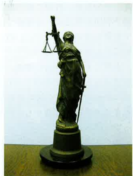
法の女神「テミス」の像