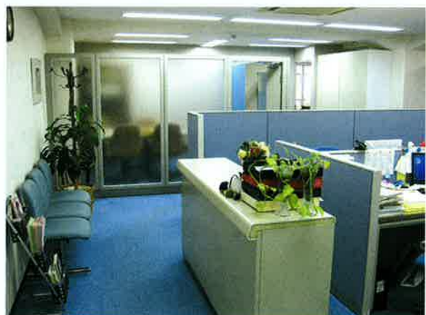
松森・高江法律事務所の室内

そのためには、裁判員裁判の評議がどのように行われているのか、裁判員を経験した方の声をもとに検証できるようにする必要がありますと感じています。